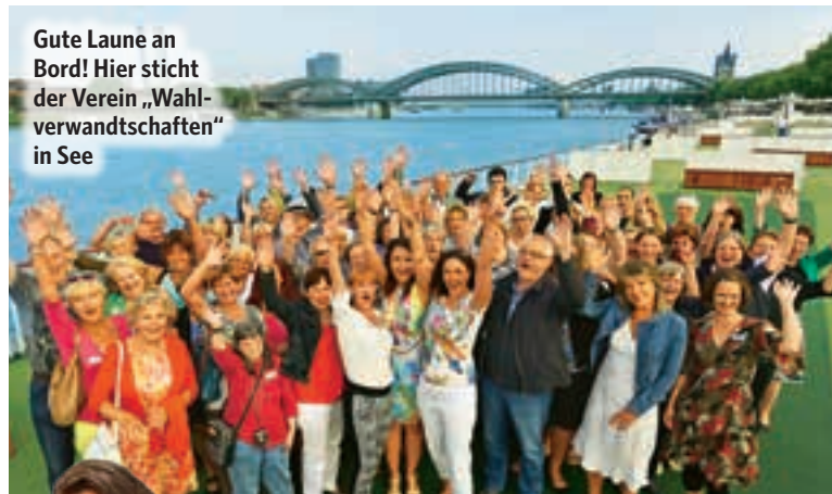
Gute Laune an Bord! Hier sticht der Verein „Wahlverwandtschaften“ in See