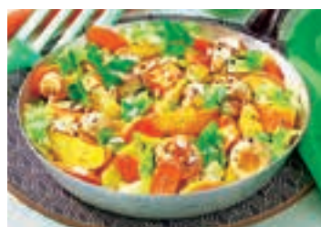
Mmh ... Kartoffelpfanne mit Spitzkohl lässt Vegi-Hezen höher schlagen

Da ich Vegetarier bin, habe ich mich über die leckeren Diät-Rezepte